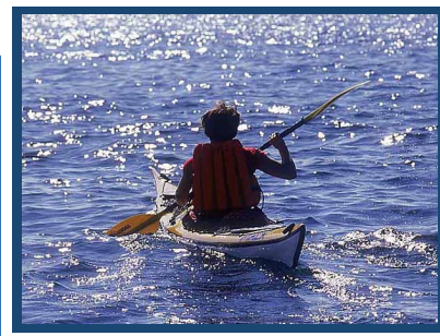
Le kayak de mer