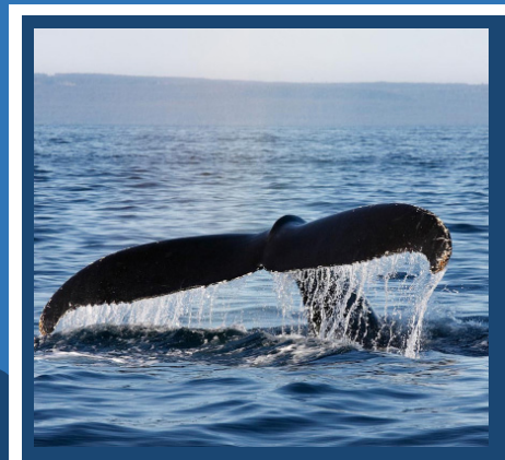
Les baleines de Tadoussac