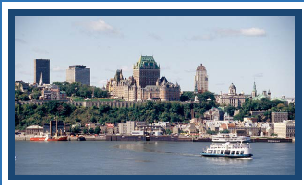
La ville de Québec