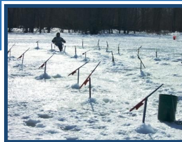
La pêche blanche