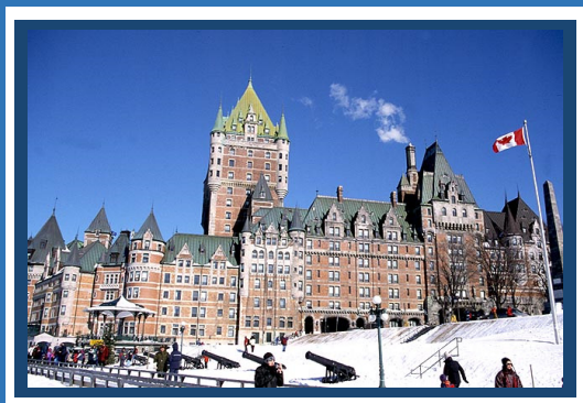
La ville de Québec