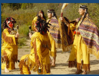
Danse traditionnelle huronne