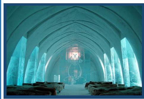
L'hôtel de Glace